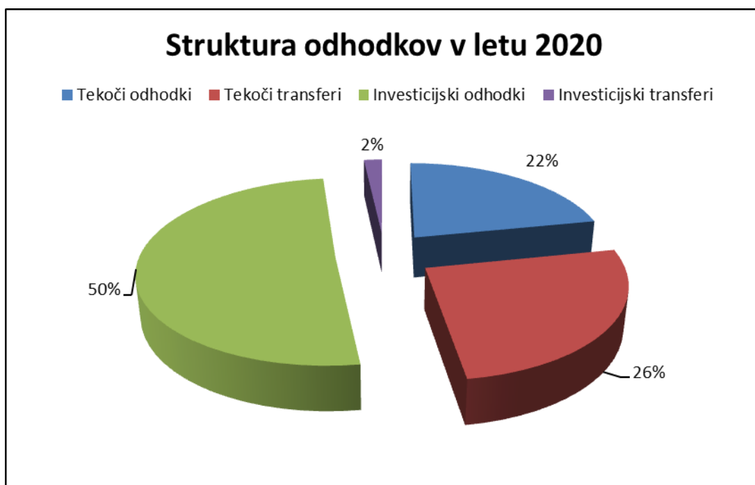
Tabela: Struktura odhodkov v letu 2020